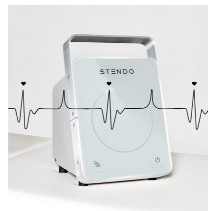
STENDO® V4: Das Steuergerät löst die kardial-synchronen Impulse aufgrund der Herzfrequenz aus, welche über einen Pulsoximeter gemessen und an die Manschette weitergeleitet werden.

Die STENDO® Pulstherapie ist aber nicht einfach nur ein neues oder anderes Lymphdrainage-Gerät. STENDO® kann viel mehr als nur Schlacken ausleiten. STENDO® erzeugt über künstliche Stimulation Scherkräfte und stimuliert so die Endothelzellen zur Produktion von Stickstoffmonoxid (NO). Durch den Stickstoffmonoxid-Transport werden Blut- und Lymphgefässe, analog einem «Reinigungsprozess», zum schnelleren Abbau von Stoffwechselabfällen erweitert, und dies wiederum führt zu einer verbesserten Nähr- und Sauerstoffversorgung des Gewebes.